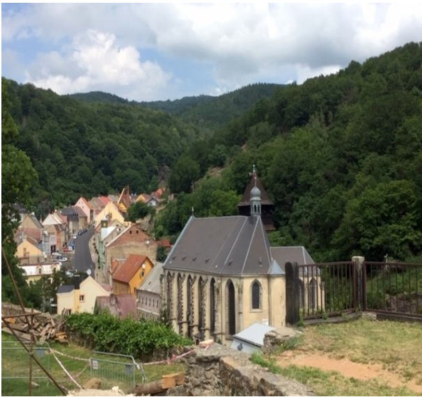
Stadtkirche von Graupen mit Blick zum Mückentürmchen