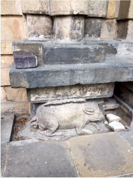
Teplitz, Skulptur zum Heilwasserfund

Nachmittag zur freien Verfügung in Teplitz-Schönau; 19.00 Uhr Konzert in der nunmehr renovierten Sankt-Borromäus-Kapelle des Teplitzer Gymnasiums; Abendessen im Hotel Prince de Ligne.