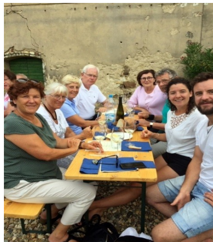
Teplitz- Freunde bei der Weinprobe