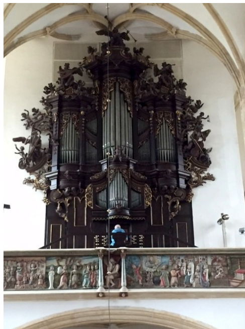
Kirche Maria Himmelfahrt innen