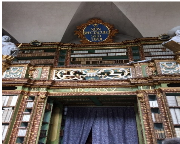
Kloster Ossegg, Bibliothek

Mittagessen in Brüx auf Burg Landeswarte; anschließend Besichtigung der Kirche Maria Himmelfahrt, die 1975 um 841 m verschoben wurde.