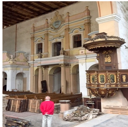
Graupen Rosenberg Blick nach Süden