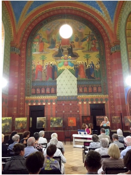
Teplitz, Konzert in Beuron-Kapelle

23. Juni: nach Frühstück 9.00 Uhr Heilige Messe und Totengedenken in der Stadtkirche Johannes der Täufer am Schloßplatz.