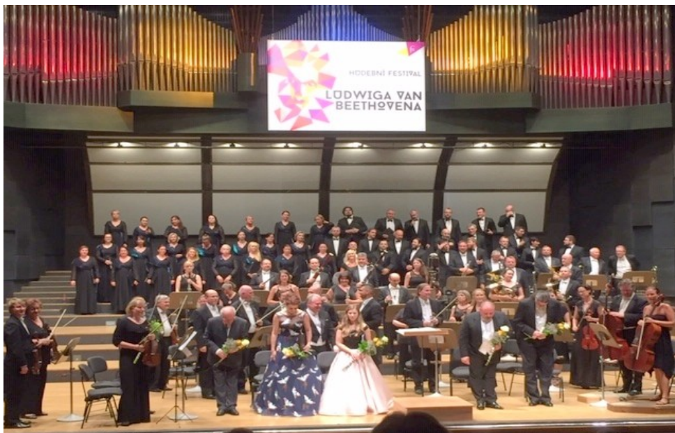
Konzert der Philharmoniker mit vier Solisten

20.Juni: Eigene Anreise nach Teplitz-Schönau, Hotel Prince de Ligne am Schoßplatz; 17.00 Uhr gemeinsames Abendessen; 19.00 Uhr Konzert der Nordböhmischen Philharmonie im Kulturzentrum Beethoven mit dem Philharmonie-Chor Brünn und vier Solisten