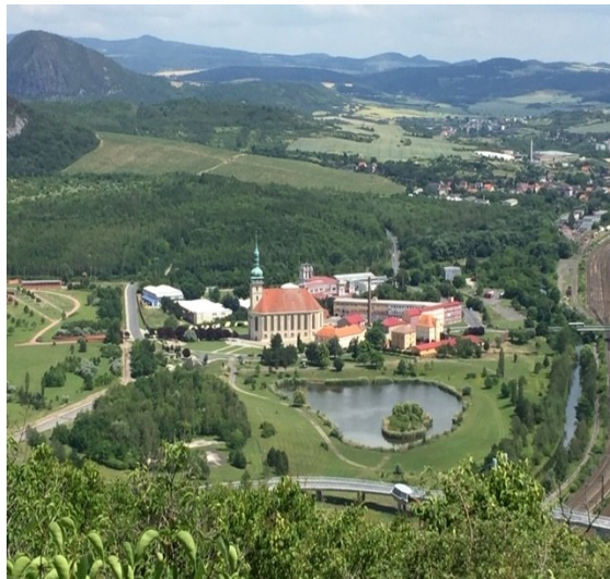
Stadt Brüx wurde zugunsten Kohleabbau ausgelöscht Standort der ganzheitlich verschobenen Kirche